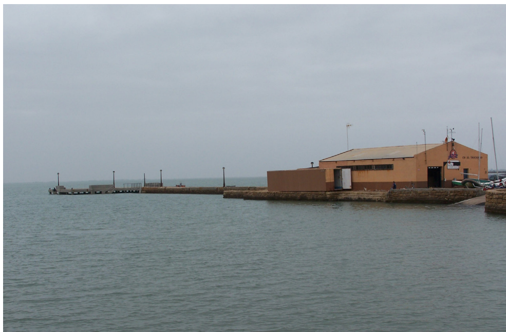
ILUSTRACIÓN 6. El muelle