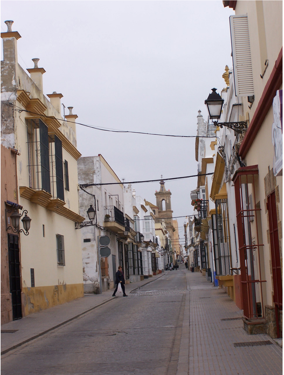
ILUSTRACIÓN 2. Una calle de Puerto Real: Vaqueros