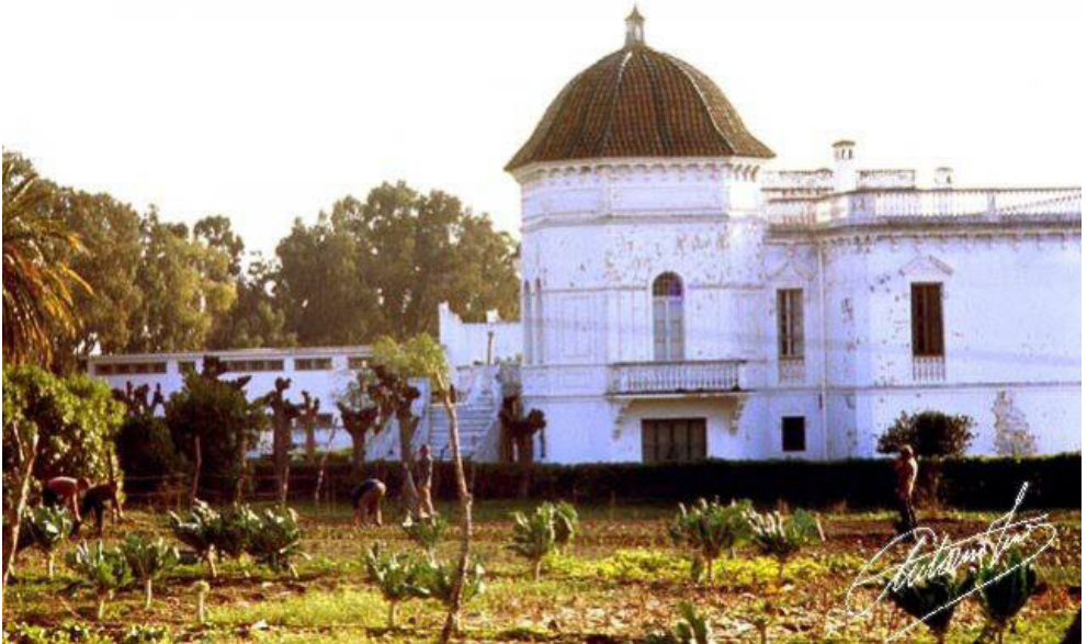
ILUSTRACIÓN 8. Quinta de recreo de Las Canteras