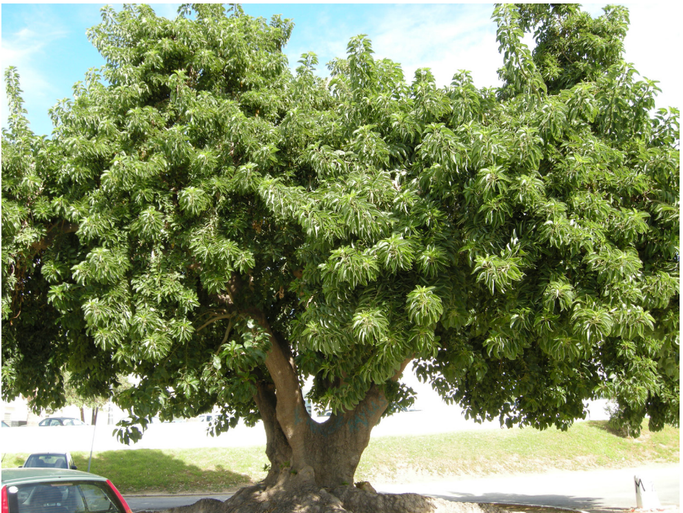
ILUSTRACIÓN 5. El árbol del balneario