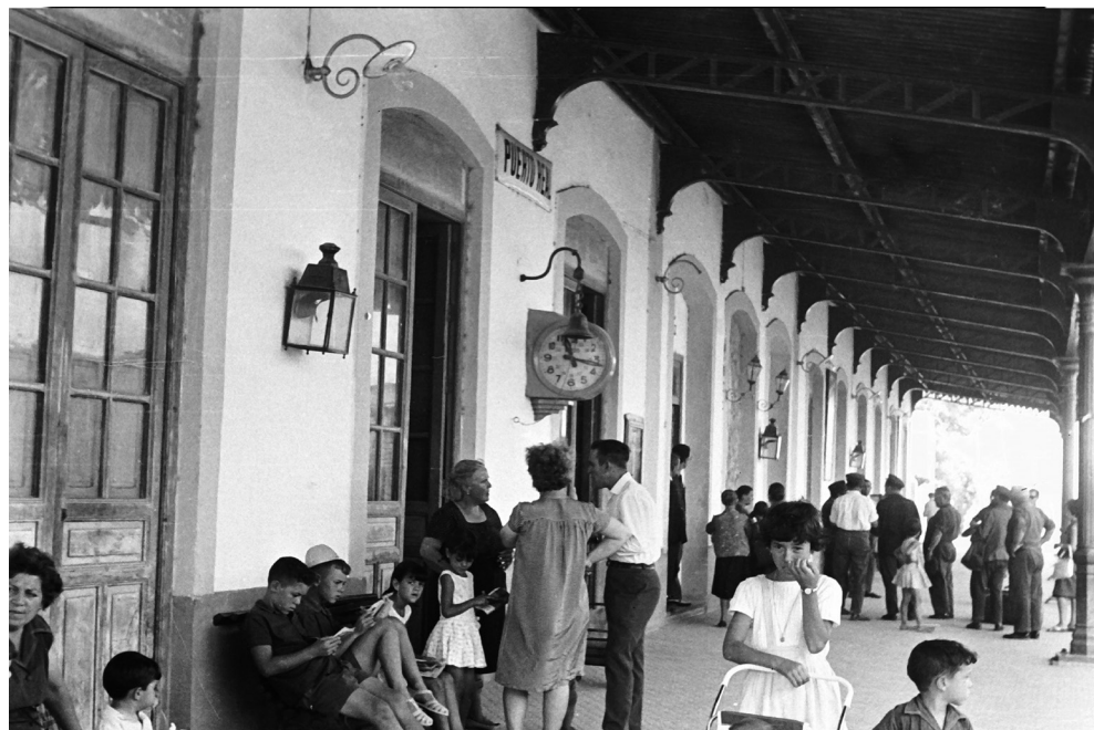
ILUSTRACIÓN 1. La Estación de Renfe