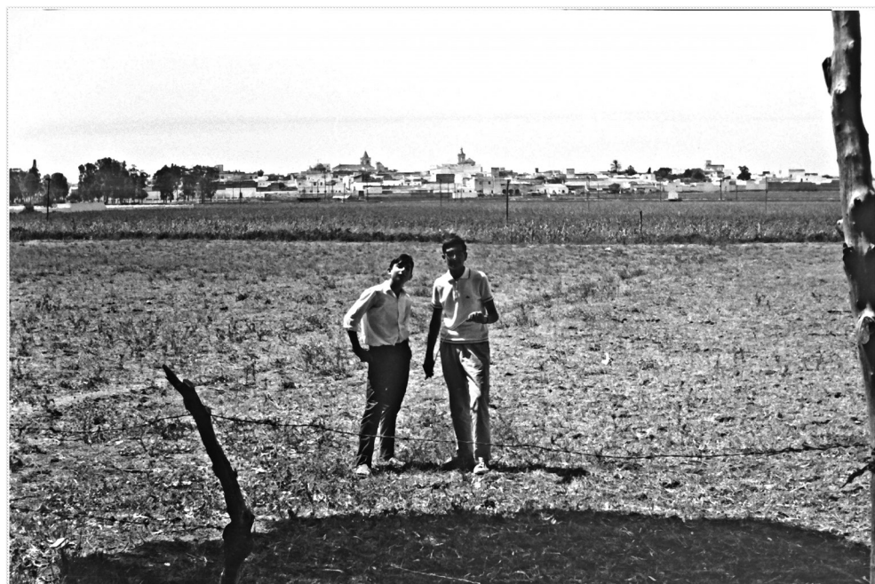
ILUSTRACIÓN 7. Puerto Real desde Las Canteras