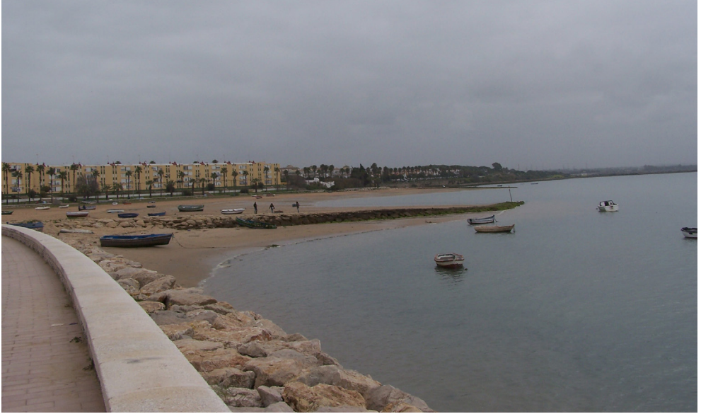
ILUSTRACIÓN 4. La antigua playa