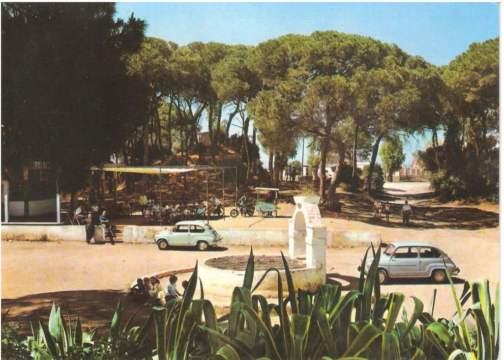
ILUSTRACIÓN 9. Patio del Pozo en Las Canteras