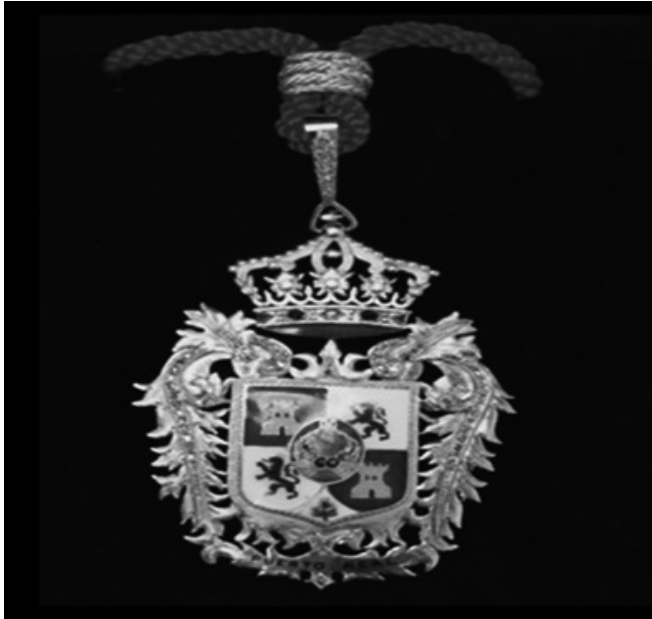
Nº8. Medalla de la Ciudad. Archivo Histórico Municipal de Puerto Real.