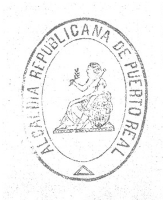
Nº4. Sello de la Primera República. Archivo Histórico Municipal Puerto Real.