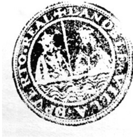
Nº3. Sello del Expediente de Justicia.