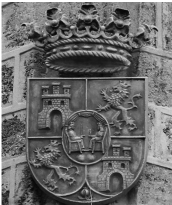
Nº9. Autor: Juan Ríos Rodríguez.